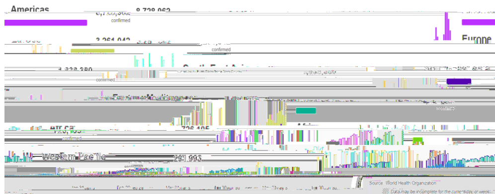
Figure 8: Nombre de cas confirmés de COVID-19, par date du rapport et région de l'OMS, du 30 décembre 2019 au 28 juillet 2020